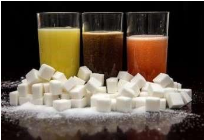
Foto 1. Karastusjookides on palju suhkrut 4 .