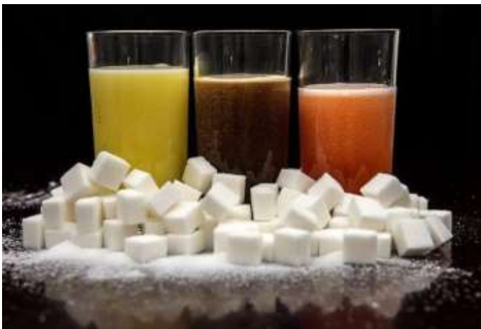
Foto 1. Karastusjookides on palju suhkrut 4 .