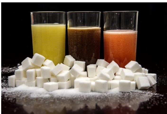
Foto 1. Karastusjookides on palju suhkrut 4